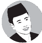
Oleh: M. Zainullah Hidayat

dilakukan dipesantren, membaca munjiyat itu tidak wajib dalam pandangan agama, namun diwajibkan dipesantren kita dengan waktu pembacaan malam jum'at dan Selasa dengan demikian perlu kiranya ada pengawasan yang sangat ketat terhadap semua para santri dari bidang ke-ubudiyahan, karena sudah tanggung jawabnya untuk menjalankan amanah yang sudah diperintahkan. Mengapa demikian ? coba kita analisa bersama berapa banyak santri yang ber jama'ah dimasjid dan