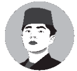
Oleh: Achmad Dani Ardiansyah

“ Tidak penting dari mana anda berasal. Yang penting kemana anda akan melangkah! ”